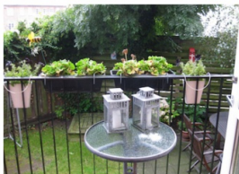
BALKON - GARD

Andelsboligforeningen valdemarsgade 54-54A Skitse 1. etage A 1.01