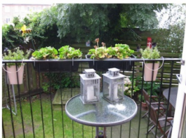
BALKON - GARD

Andelsboligforeningen valdemarsgade 54-54A Skitse: 1.01 1:50