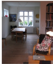
STUEN MED VINDUE MOD VORES LILLE HAVEGARD

2 DEJLIGE SMA VINDUER DER GIVER LYS OG SOL