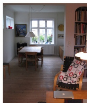
STUEN MED VINDUE MOD VORES LILLE HAVEGARD

2 DEJLIGE SMA VINDUER DER GIVER LYS OG SOL